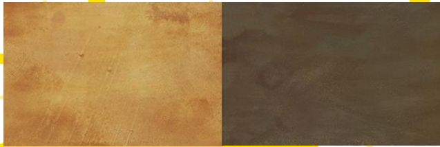
Red Rust 01